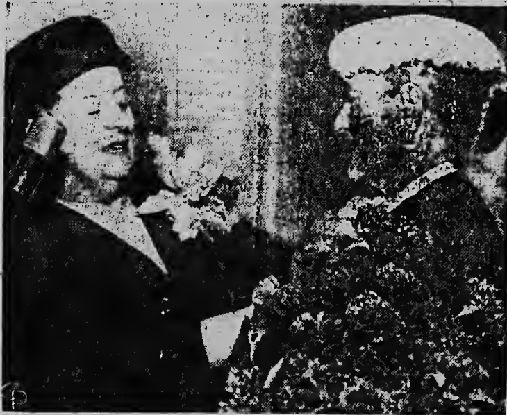
Na Los Angeles